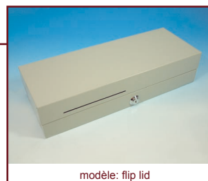
modèle: flip lid