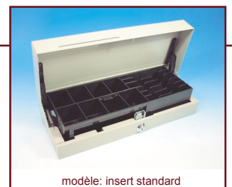
modèle: insert standard

Les spécifications peuvent changer sans notification préalable